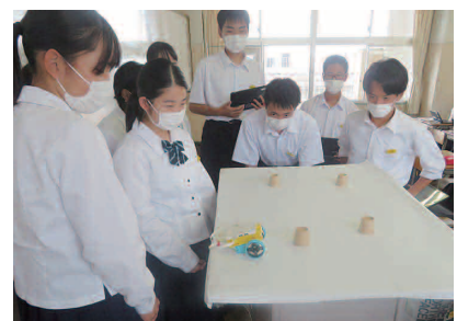
普通科授業風景(STEAM教育)