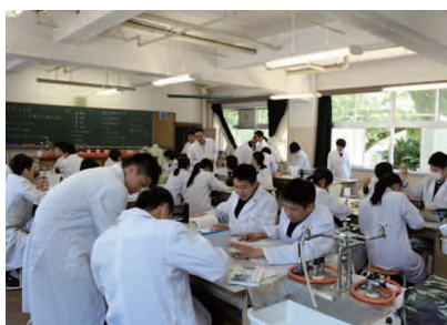
普通科授業風景(実験)