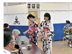
茶 道 部