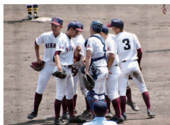
野 球 部