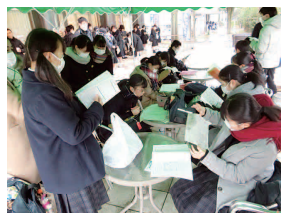
大学入学共通テスト