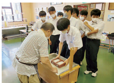
地元産業工場見学