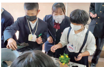
えひめ次世代マイスター育成事業