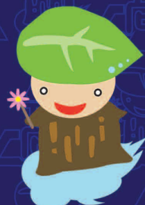
マスコットキャラクター 「くすのきくん」