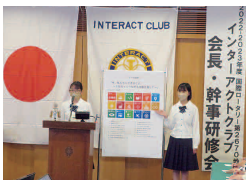
インターアクト部