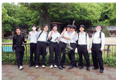
フィールドワーク(3年)

★充実した実り多い高校生活となるよう、本校は生徒が主体になった各種の行事にも力を入れています。