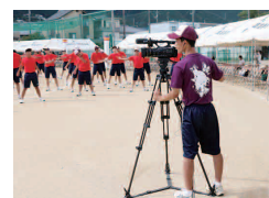
放 送 部