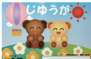
じゅうが帳デザイン採用