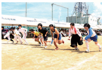
体育祭(部対抗リレー)