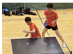
卓 球 部