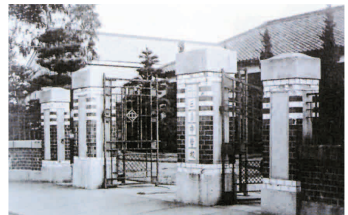
旧制愛媛県立三島中学校正門